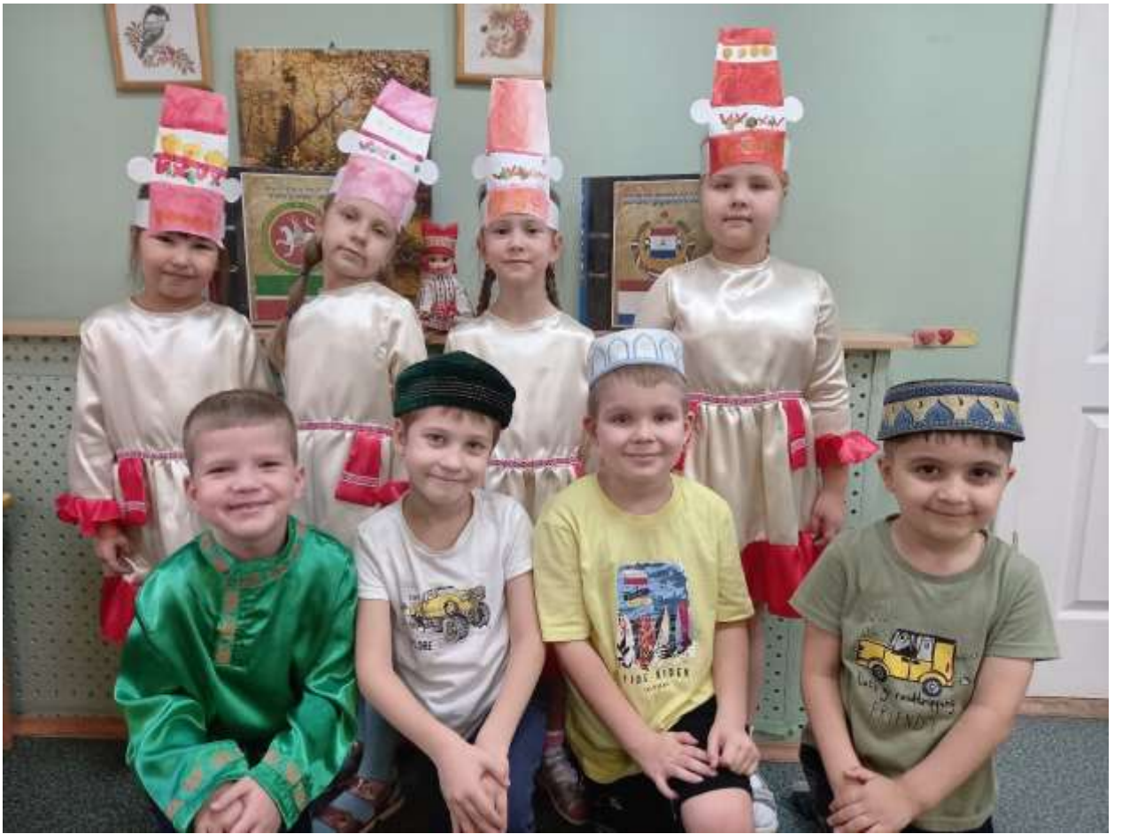
Развлечение «Мы вместе»