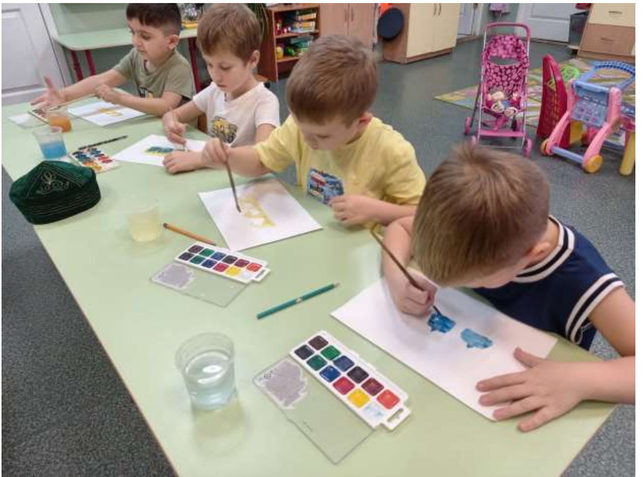
Рисование «Головные уборы»