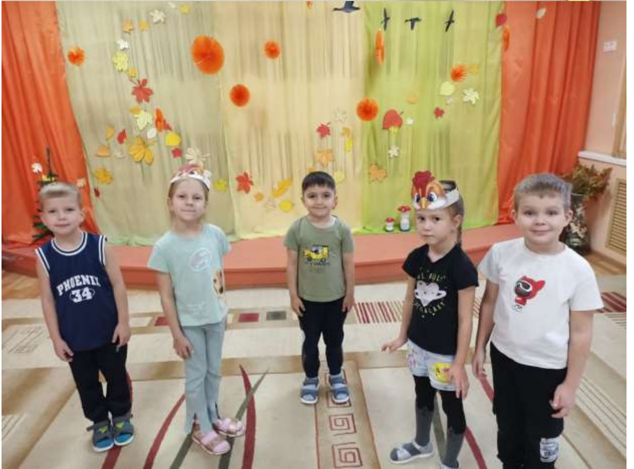
Народные игры «Курочка», «Юрта»